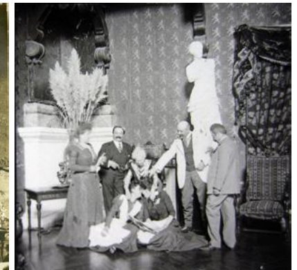
Angle Sud Est