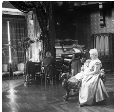
Angle Nord Est

Différentes Photographies montrant les faces du grand Salon et permettant de proposer une restitution des éléments de décor et de mobilier